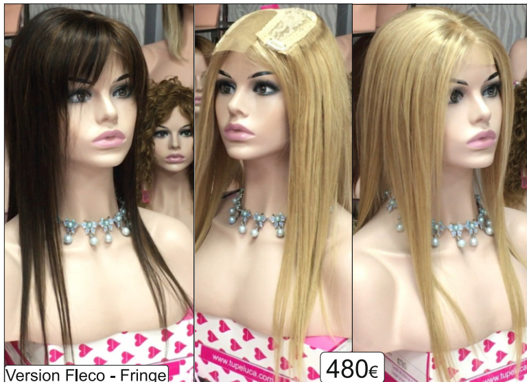
Version Fleco - Fringe